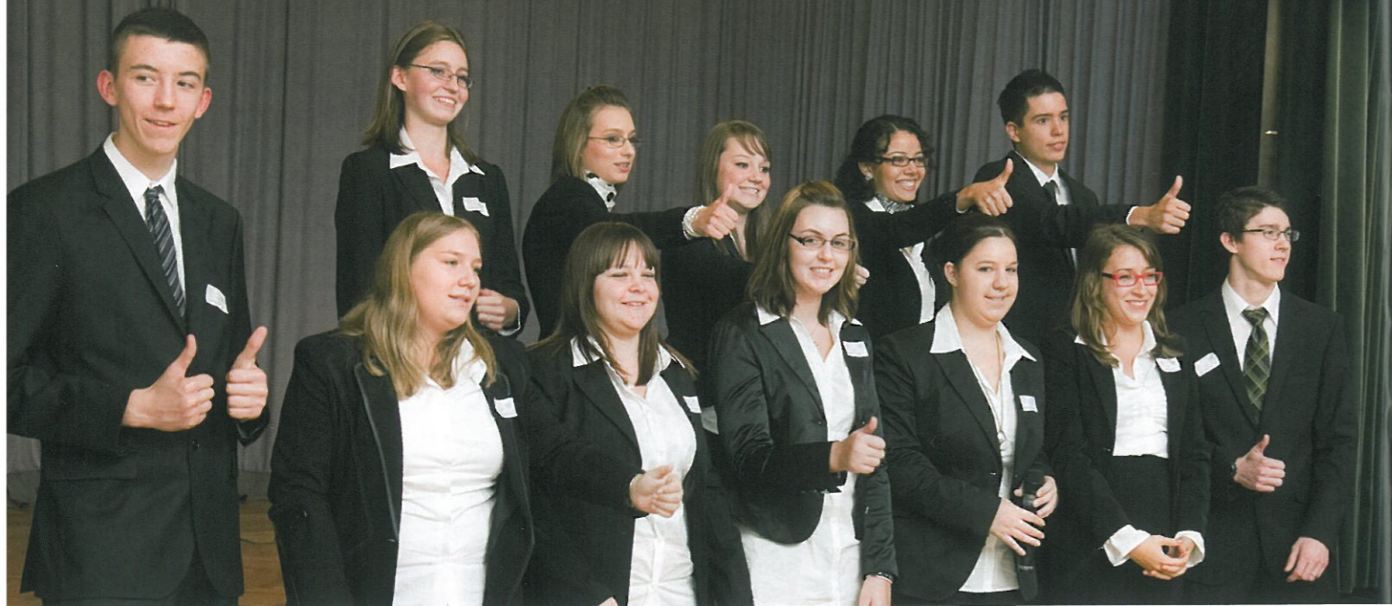
Die Teilnehmerinnen und Teilnehmer des Ausbildungsschwerpunktes „Steuer- und Unternehmensberatung“ bei der Startveranstaltung im Vorjahr.